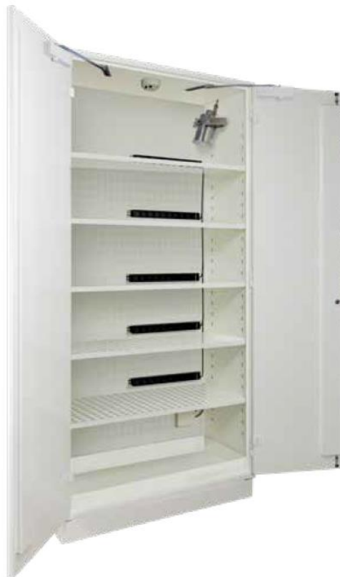
▲ S2004+LIA5 + 5 PRISELI + GL04 + 2 PEXTBALI50