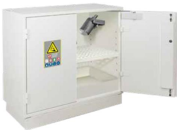
▲ S806+LIA1 + PRISELI + GL06 + PEXTBALI50

15 min Ohnivzdorná konstrukce (zevnitř ven) certifikováno EI 15 min typ A1, ve shodě s normou ČSN EN 13501-1