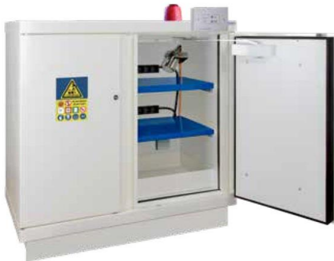
▲ 793+LIX2 + 2 PRISELI + B235