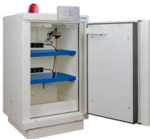
▲ 798+LIX2 + 2 PRISELI + B148