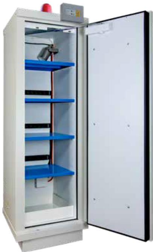
▲ 794+LIX4 + 4 PRISELI + B148