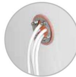
Otvory pro protažení kabelů PEXTBALI