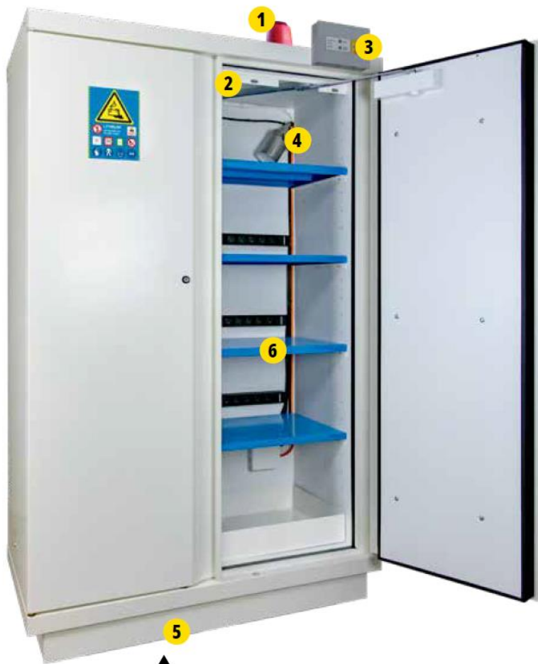
▲ 795+LIX4 + 4 PRISELI + B235